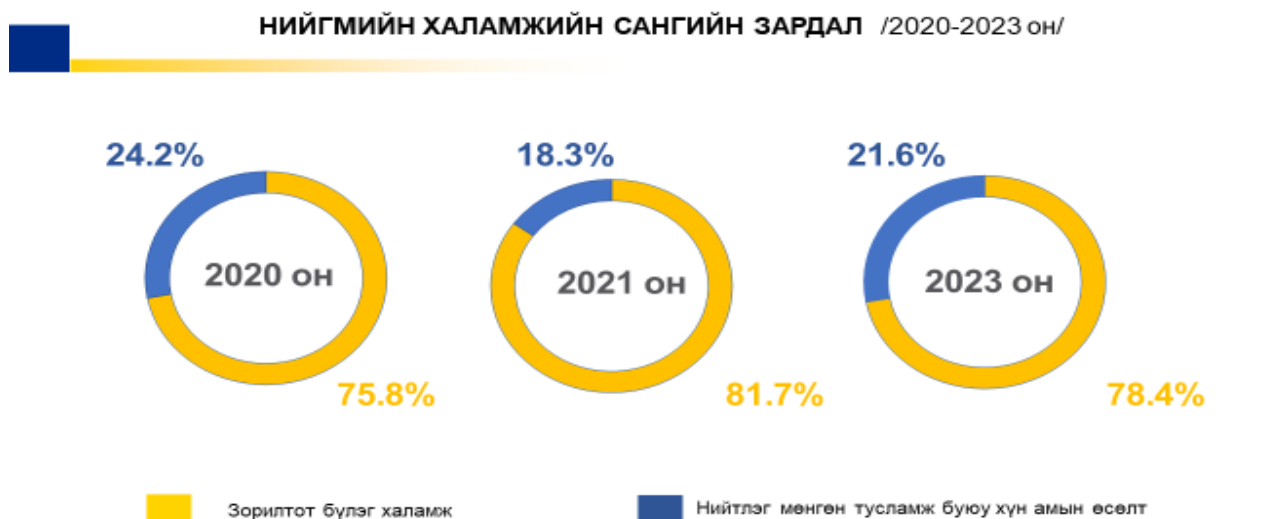
Зураг 3. Нийгмийн халамж болон нийтлэг мөнгөн тусламжийн зардал /2020-2023 он/

Нийгмийн халамжийн зардал жил бүр нэмэгдэж байгаа ч 75-80 орчим хувь нь амьжиргааны түвшин харгалзахгүй нийтлэг хэлбэрээр олгож байгаа хөтөлбөрт зарцуулж байна. Цалинтай ээж, одонтой эх, хүүхдийн мөнгө, насны хишиг, жирэмсэн эхийн тэтгэмж зэрэг амьжиргааны түвшин харгалзахгүй нийтлэг олгож байгаа хөтөлбөрт зарцуулж байна.